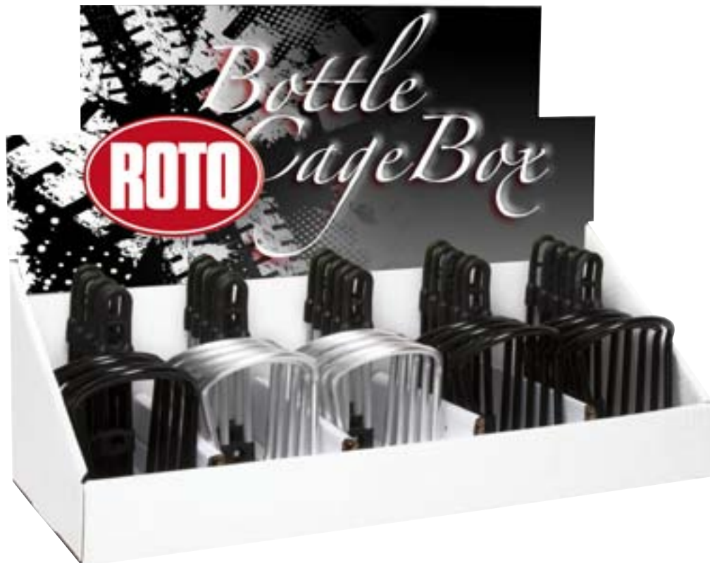
Cartoncino per imballo After Market After Market packing cardboard